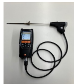
一酸化炭素測定器