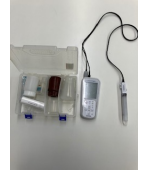
電解水専用キット