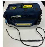
冷媒ガス漏れ検知器